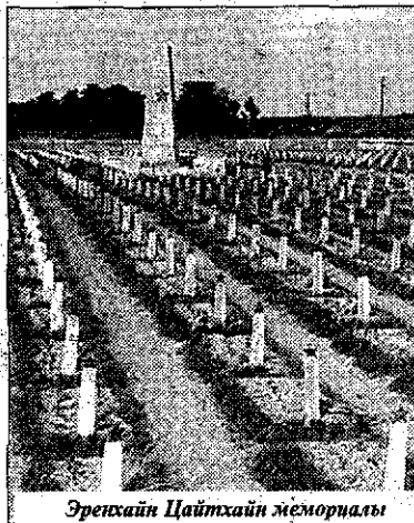
Эрехайн Цайтхайн мемориалы