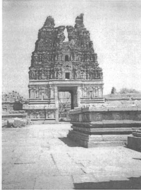
Рисунок 4 – Ворота, служащие входом на территорию храма

Входом на территорию храмового комплекса служат ворота (рисунок 4), над которыми возвышается многоярусная башня, доминирующая не только над ансамблем, но и над всем городом. В башне в наиболее последовательной форме выразились многие существенные стороны индийской архитектуры.