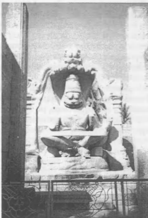
Рисунок 1 – Скульптура Господа Нрисимхи

Улицы города выложены обработанными каменными плитами. В городе встречаются строения, возведенные непосредственно на скальных породах. К ним ведут прорубленные в скалах ступени, стёртые и отшлифованные временем. Памятники архитектуры Хэмпси воздвигнуты на сложном рельефе, в окружении каменных глыб. Эти глыбы разложены так, что у тех, кто впервые побывал там, возникает мысль, будто какое-то огромное фантастическое существо разложило их, словно детские кубики.