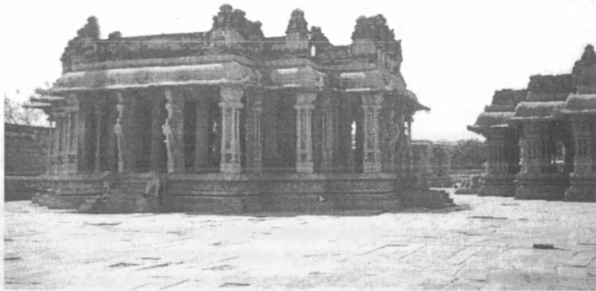
Рисунок 2 – Один из храмов древнего города Хэмпси