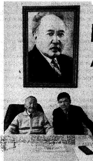
сол әулетпен туыстық байланысын үзбеді, бас тартпады. Әйтпесе, 30-шы жылдардан кейін Тұрағұлдың атын атау